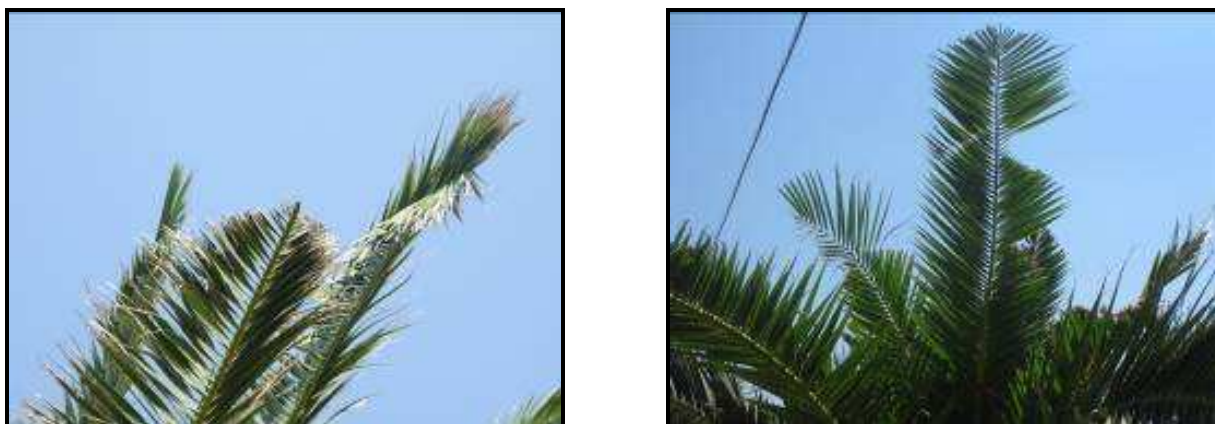
Fig. 3 Margini seghettati e rosure fogliari

I primi sintomi riscontrabili sulle palme sono l'asimmetria della chioma e la presenza di foglie spezzate o con margini seghettati.