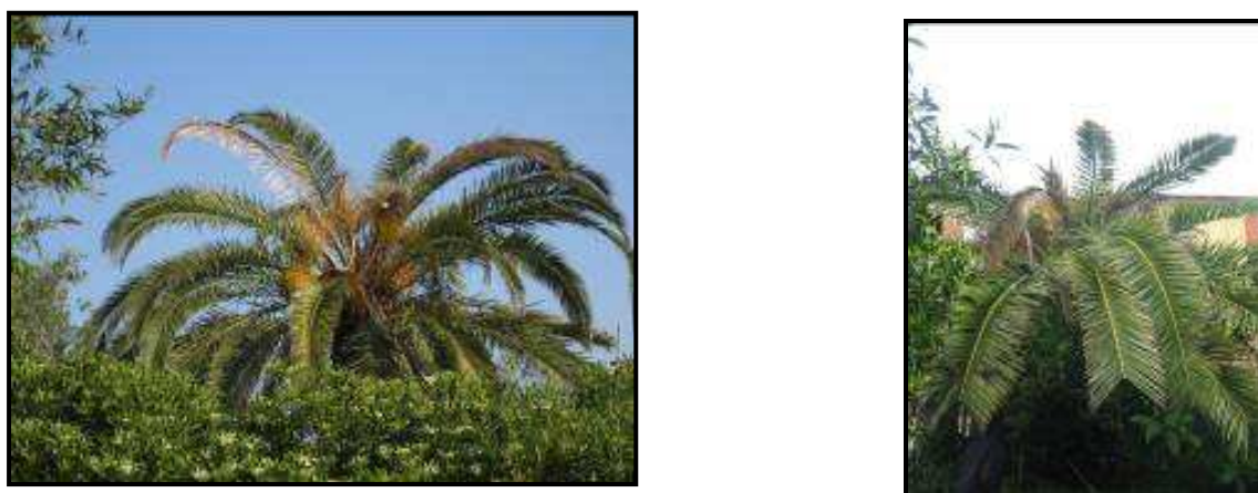
Fig. 4 Asimmetria della chioma e appiattimento

Successivamente si ha un gradiente di danno sempre più intenso con la cima che si piega e la chioma che si appiattisce. La pianta, da un'osservazione a distanza, appare come appiattita.