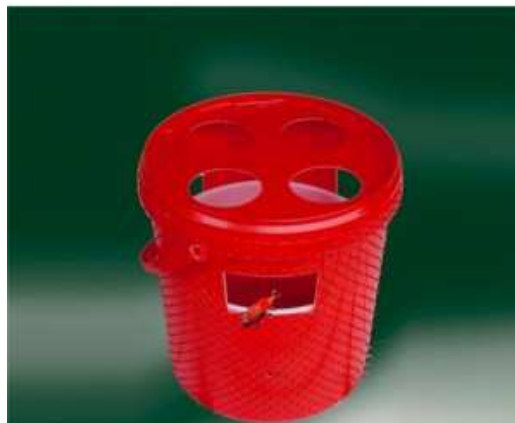
Fig. 1. Trappola a feromoni